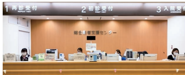
総合患者支援センターの各窓口