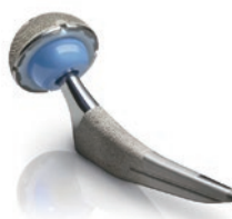
股関節インプラント

最後に、常に変化し続ける社会の中で、私たち整形外科医が担う役割は、更に大きくなると実感しています。最高水準の医療を意識し、試行錯誤しながら、一人ひとりが自己研鑽を続け、協力しあうことが必要です。患者さんの健康と幸せを守るために、私は、教室員と共に、全力で取り組んで参ります。今後とも、ご支援とご指導を賜りますよう、よろしくお願い申し上げます。