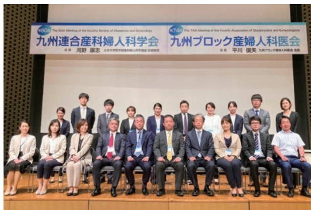
第80回 九州連合産科婦人科学会 第74回 九州ブロック産婦人科医会にて

皆さまからのご意見やご要望も大切に、より良い医療サービスを提供できるよう日々努めてまいります。