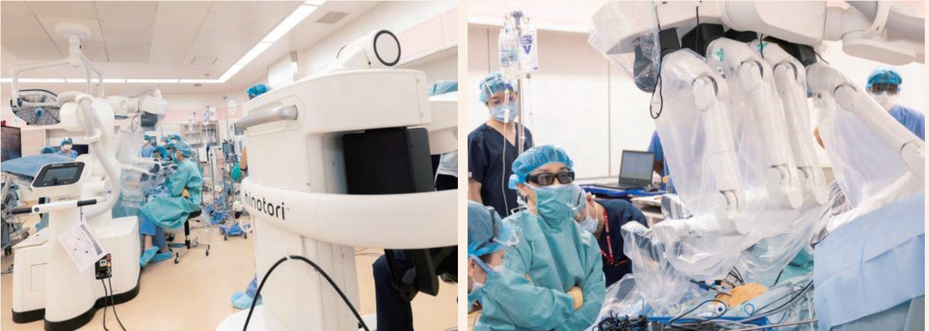
図2.3 九州初の「hinotori™」を使用したロボット前立腺全摘術

また低侵襲手術センターの取り組みとして、2022年10月25日-27日に大分ロボット手術体験セミナーを開催しました。本セミナーでは、医療スタッフだけでなく、一般職員や学生が実際の手術ロボットを体験できるようなプログラムを行いました(図4)。この取り組みは県内の報道機関に大変注目され、民放3局やNHKから取材・テレビニュースが報道されることになりました。また一般市民に向けては2022年11月6日に市民公開講座「もっと知りたい! からだに優しいロボット手術」を開催し、ロボット手術の啓発活動に努めました(図5)。