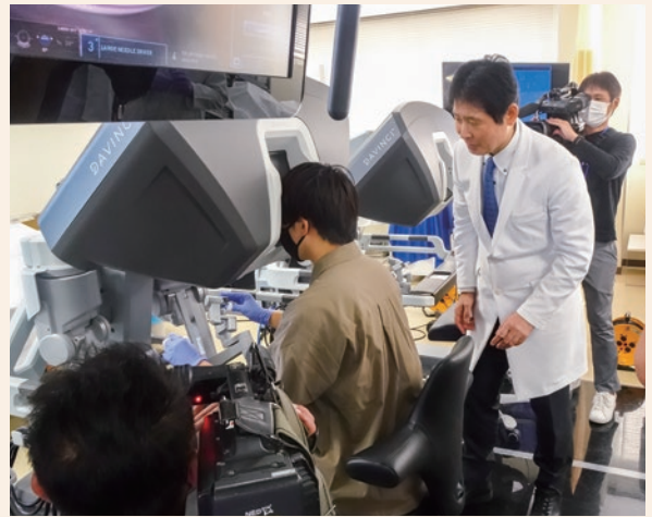
図4 大分ロボット手術体験セミナー

これからも本センターの取り組みを通じて、①患者さんの手術待ち時間を短縮する効率的な手術ロボットの運用、②安全管理体制の更なる強化、③高度技術を有する医療人育成に努めていく予定です。