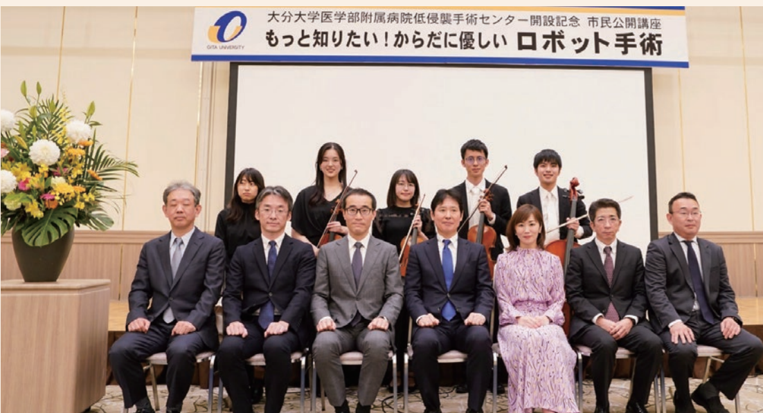
図5 11月6日開催 市民公開講座

これからも本センターの取り組みを通じて、①患者さんの手術待ち時間を短縮する効率的な手術ロボットの運用、②安全管理体制の更なる強化、③高度技術を有する医療人育成に努めていく予定です。