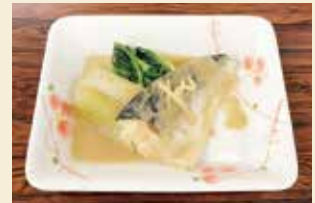
※写真のお皿は15.5×12cm、盛り付けは1人分です。