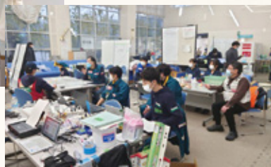
医療救護活動状況