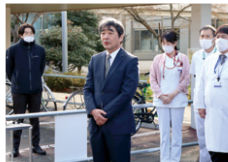
激励の言葉を述べる木内病院長

本学医学部附属病院では、厚生労働省および山梨県からの要請により、DMAT(※)の派遣要請を受け、当院DMAT隊4チームを下記のとおり派遣しました。