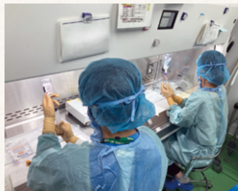
抗がん剤調製業務