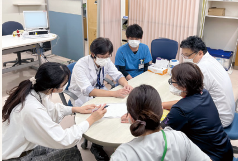
チーム医療【褥瘡対策チーム】

革新的な新薬は、作用機序も新規性があるため副作用発現に細心の注意が必要になってきています。患者さんの状態変化や副作用の早期発見、薬による有害事象を回避することなどは安全管理の観点から非常に重要であり、薬剤師は病棟業務やチーム医療への参画を通して、患者さんが安心して適切な薬物療法を受けられるよう、ベッドサイドや外来面談室で積極的に業務を行っています。