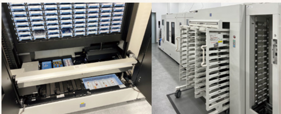
注射薬自動払出装置

医学が進歩し、革新的な新薬が次々に登場する中で、薬物療法における薬剤師の関与が極めて重要となっています。このような状況において薬剤師は、調剤をはじめとする医薬品の供給や管理を中心とした対物業務から、病棟やベッドサイドで薬物療法を支える対人業務にシフトするため、対物業務の質を維持したまま効率化を図り、その上で病棟業務やチーム医療へのさらなる参画を目指しています。