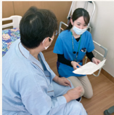
ベッドサイドでの患者面談

また、患者さんを中心とした薬物療法がシームレスとなるように、当部では定期的な勉強会の開催などを通して、地域の保険薬局および医療機関との施設の垣根を超えた協働・連携強化に努めています。