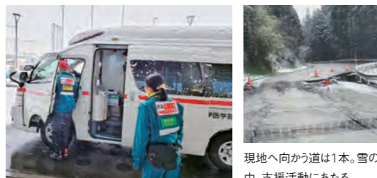
現地へ向かう道は1本。雪の中、支援活動にあたる。