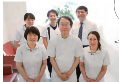
スタッフのみなさん

患者さまやご家族を第一に考え、“ともに歩む医療”を実践しています。多職種が一丸となり、専門性の高い医療を提供していますので、腎・泌尿器、透析、緩和医療について、どんなことでもお気軽にご相談ください。