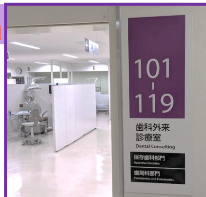
歯学部棟2階 歯科外来診療室