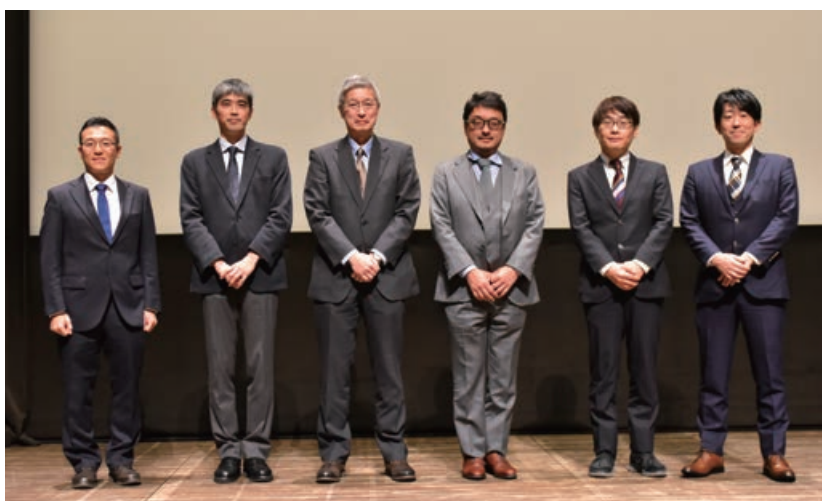
香川大学医学部附属病院 膵臓・胆道センター 市民公開講座