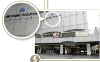
5 ホテル正面玄関へ到着。