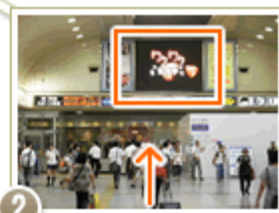
2 正面に大型ビジョンを 見ながらエスカレーターを 下る。