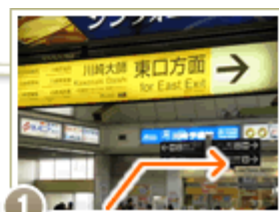
1 改札口(1箇所)を出て、 右手(東口方面)に進む。