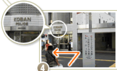
4 左正面の交番の左横を通り、 横断歩道を渡る。