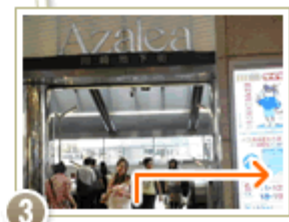
3 まっすぐ進み、突き当りに 「川崎地下街Azalea(アゼリア)」 が見えたら、エスカレーターに 乗らずに右手外へ進む。