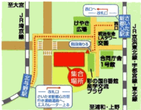
(さいたまアリーナ関係者駐車場)