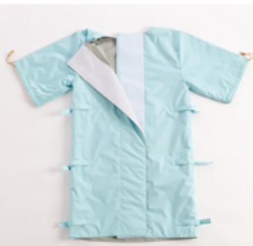
図2 MRIプロテクター フィットコート