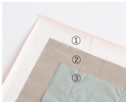
図1 MRIプロテクターの構成 ①表生地ナイロン ②銀メッシュ ③裏生地ナイロン