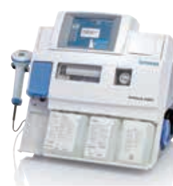
血液ガス分析装置 RAPIDLab 348EX

共催：公益社団法人 北海道臨床工学会 シーメンスヘルスケアダイアグノスティクス株式会社