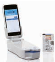
血液ガス分析装置 NXS ホスト搭載 epoc