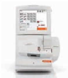
血液ガス分析装置 RAPIDPoint 500e