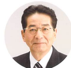
仙谷 由人 (元官房長官)