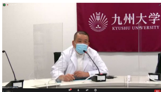
【国府島医師の発表】