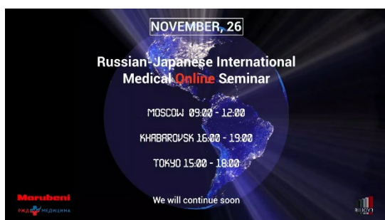
【セミナーウェブサイト】

セミナーには1,400人を超える参加があり、予防医療や日本の健診に対する関心の高さがうかがえた。