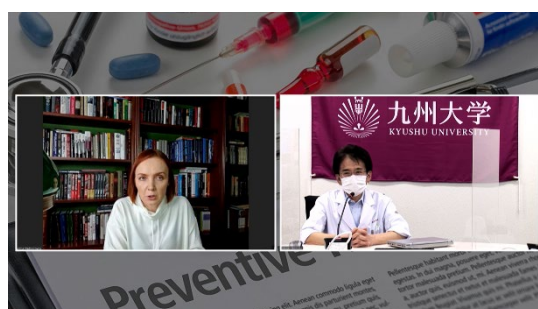
【下野医師 質疑応答】