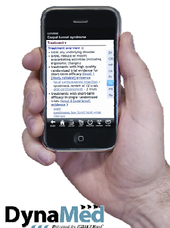
DynaMed Powered by EBSCO Health