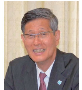
認定 NPO 全世代代表理事 尾身茂

新型コロナワクチンを接種する医師が不足している地域と先生のキャリアを繋ぐ事業です。是非ご登録ください。