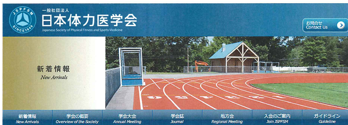
■ホームページ使用例