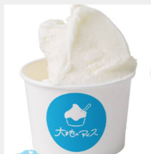
北海道ミルクアイス