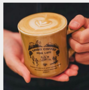
コーヒー・焼菓子