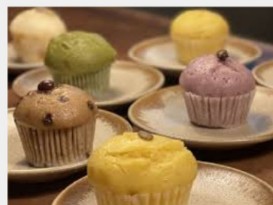
道産食材スチームマフィン