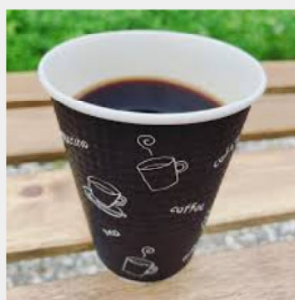
コーヒー・サンド