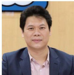
WONCA APR President (台湾)