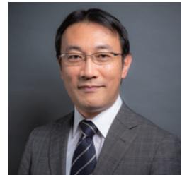
WONCA APR Honorary Treasurer (日本)