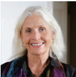
WONCA 前会長 (ノルウェー)