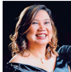
WONCA APR Honorary Secretary (フィリピン)