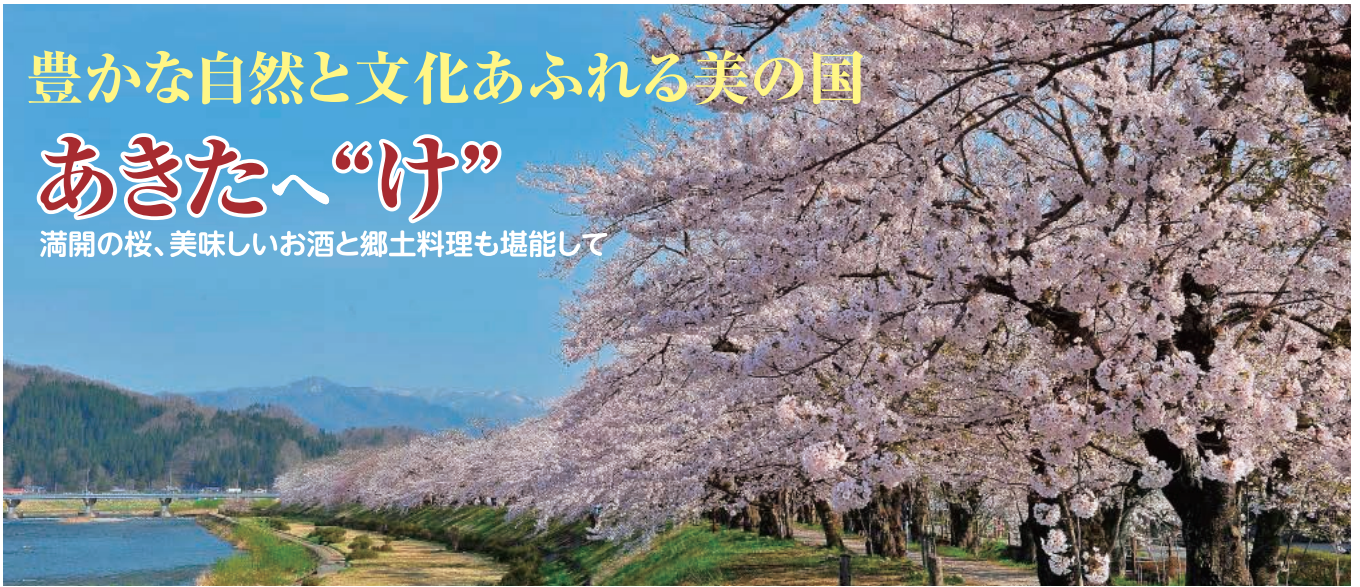
桧木内川堤の桜並木