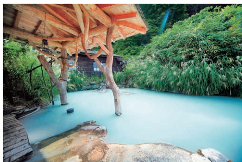
乳頭温泉郷「鶴の湯」