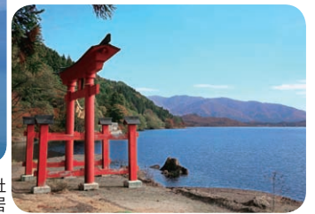
御座石神社 の鳥居