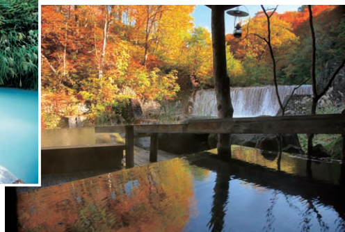
乳頭温泉郷「妙の湯」