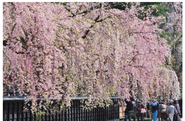
角館・武家屋敷通りのシダレザクラ

秋田市内から車で1時間程度走れば、豊かな各地の文化と自然を感じられます。同じく会期のころ、“みちのくの小京都”とよばれる 角館 でもシダレザクラが見頃を迎える大変美しい季節です。江戸時代末期の屋敷が立ち並ぶ「武家屋敷通り」は国の重要伝統的建造物群保存地区に指定されており、黒塀の武家屋敷に桜が映える絶好の撮影スポットです。また、 ひのきないがわ 、 桧木内川 の堤防沿いに約2kmにわたって約400本のソメイヨシノが並び桜のトンネルが続く風景は武家屋敷通りの桜とともに「さくら名所100選」に