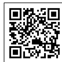
表 2、3、4 については、複数のお申し込みがあった場合、2024 年 4 月 30 日(火)以降に学術集会側にて決定させていただきますご連絡いたします。

【協賛申込フォーム】 https://a-youme.net/c_form/jane/form.php