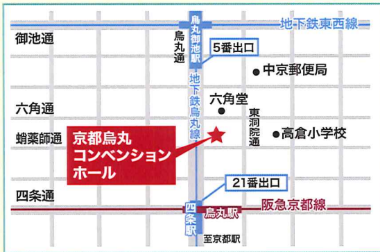
◎地下鉄「烏丸御池」、「四条」、阪急電車「烏丸」から徒歩約4分

5月20日(日) 14:00~16:00 京都烏丸コンベンション ホール 中ホール (京都市中京区烏丸通六角下ル)