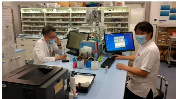
処方鑑査・疑義照会