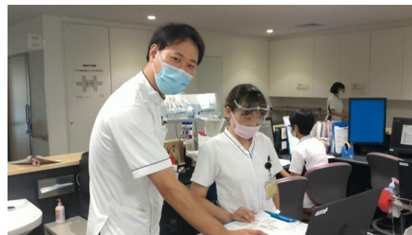
病棟業務 全病棟薬剤師配置