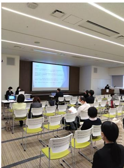
若手薬剤師の口頭発表の様子