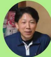
八幡浜医師会 居宅介護支援事業所 清水建設

ご連絡いただければコーディネーターがご自宅にお伺いして地元での療養体制についてご説明いたします。