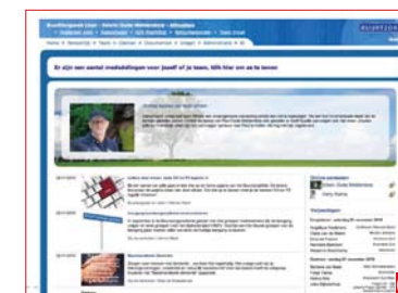
01 Buurtzorg の玉ねぎモデル (翻訳および出典は堀田聡子氏提供の資料)。 02 Buurtzorgweb の画面。OMAHA システムに基づき全体が設計されている。 03 「歩行器」レースの参加者と様子。

テーマ : Buurtzorg とはなにかーオランダ発 在宅ケアの新しいモデル 日時 : 2012年10月23、24日 場所 : 東京大学情報学環 福武ラーニングシアター (23日)、医学書院 会議室 (24日)