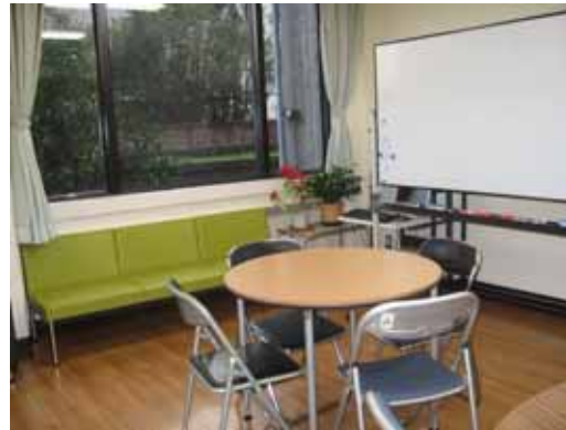
皆がくつろぐ部屋