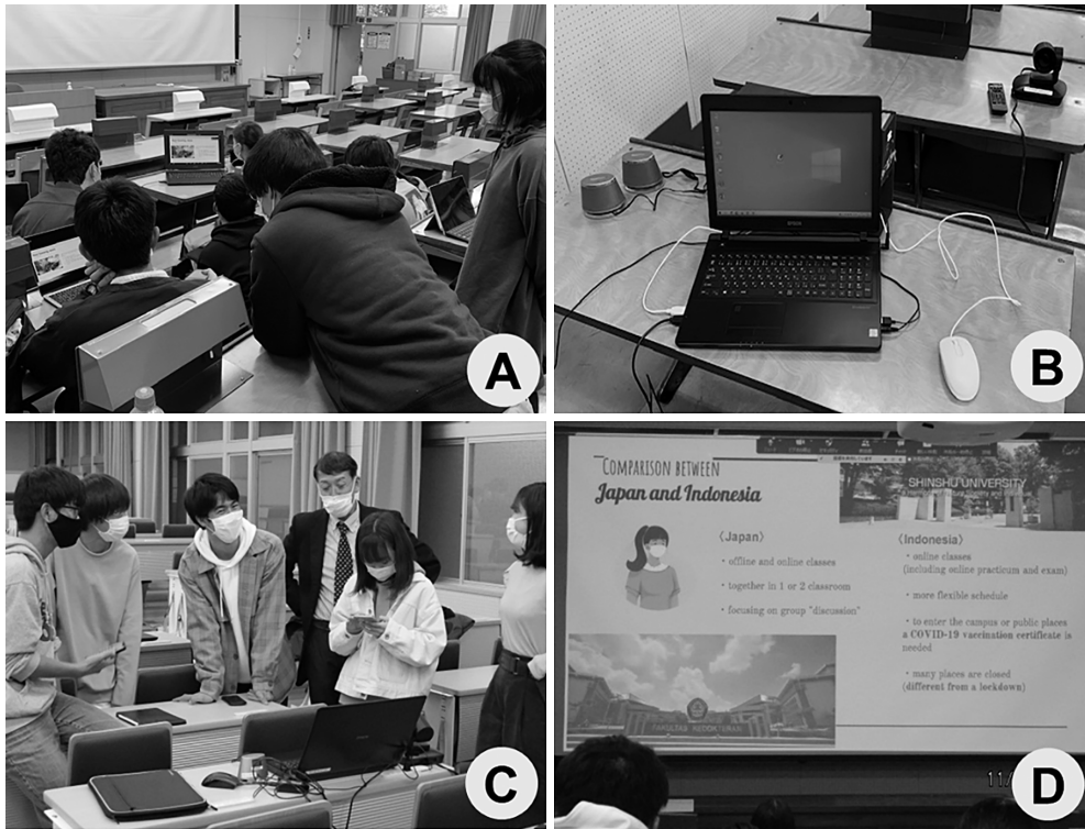
図1 インドネシア ディポネゴロ大学医学部 2年生との COIL