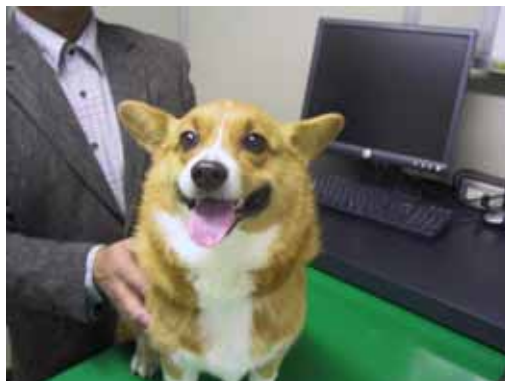
元気になったコーギー