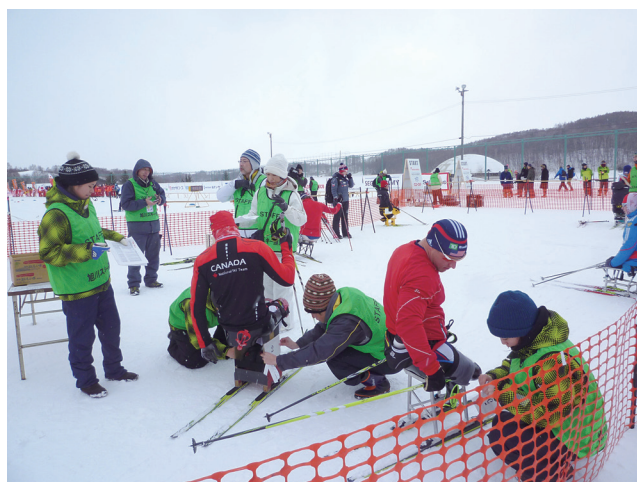
2015年2月旭川富沢で開催された障がい者クロスカンリースキーワールドカップ 医大学生ボランティアの活動

今までの活動に加え、今後国際大会に帯同・協力する医療関係者を育成するため国際レベルのスポーツ医学教育・研究を行い、その経験を活かして地域住民に最良のスポーツ医学に触れる機会を提供したいと考えております。