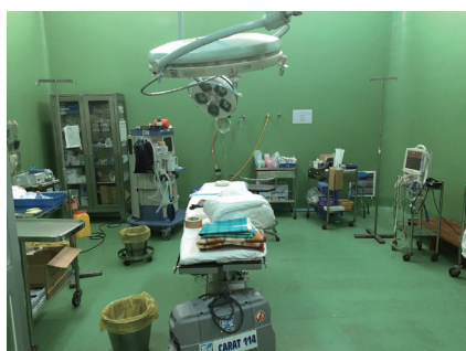
▲到着後に整備した手術室です