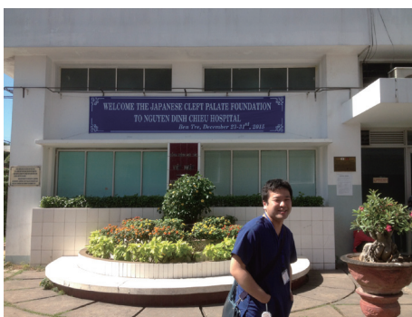
◀12月の ベトナムベンチェ州 グエンデンチュー病院 手術棟玄関