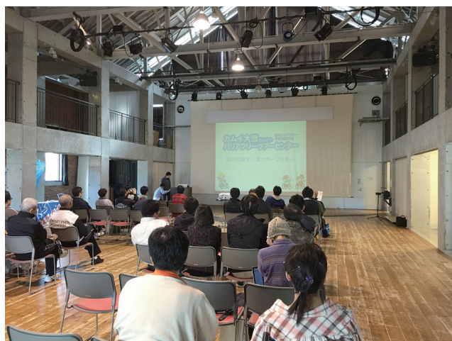
2015年10月 障がい者文化スポーツの集い 医大職員実行委員として参加