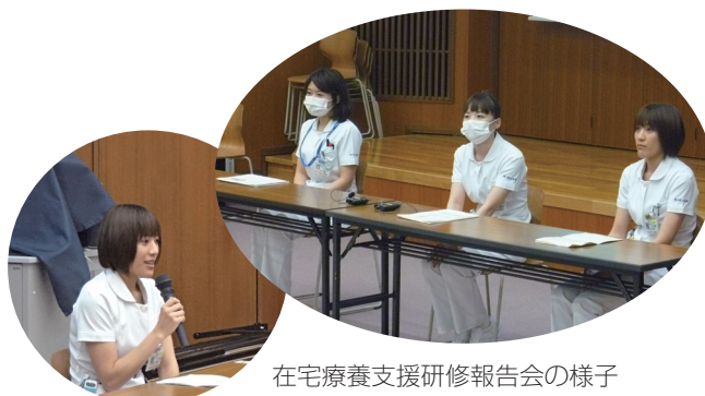
在宅療養支援研修報告会の様子