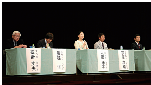
2015年2月市民公開講座