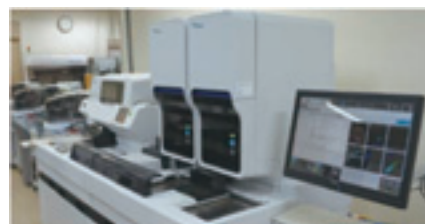
写真：自動血球分析装置 (XN-3000)