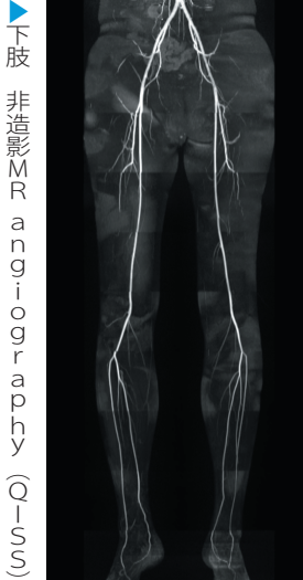
▶下肢 非造影MR angiography (QISS)

新しいMRIでは、画質や撮像スピードが非常に向上しており、新しい撮像法も導入されています。新しいダイナミック造影MRI(TWIST-VIBE)では、画質を保ったまま数秒毎の高速撮像が可能となり、より