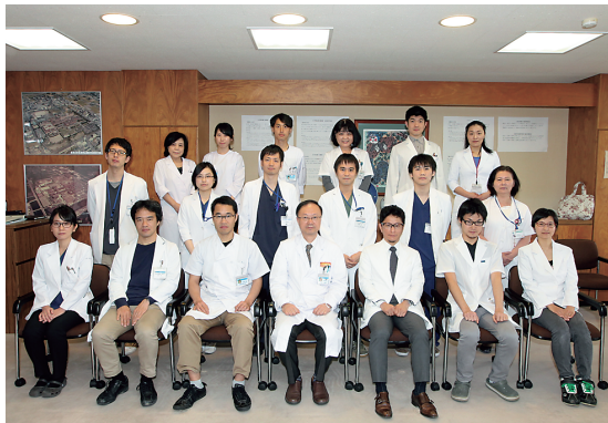
▲神経内科のスタッフ

さらに、神経難病、特に筋萎縮性側索硬化症やパーキンソン病を中心とした佐賀県の神経難病支援ネットワークを構築し、佐賀県内の各地域の拠点病院と連携しながら、治療方針の決定や療養型病院での治療に対するコンサルトや助言などを行っています。