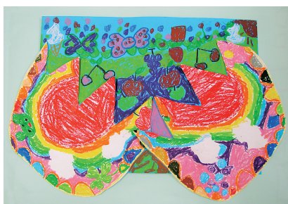
▲院内学級の児童生徒による作品