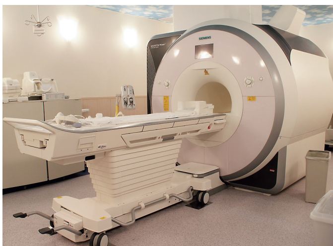
▲放射線部3テスラMRI MAGNETOM Prisma

詳細な病変の血流動態の評価が可能です。新しいQISS法を用いた非造影のMR angiographyは、画質が向上しており、四肢などの末梢血管の評価に有用です。今後、新しいMRIを用いて臨床及び研究に貢献していきたいと思えます。