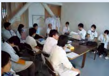
写真の掲載方法から実験方法まで発表の方法をアドバイスする

患者さんに質の高い医療を提供するため大学病院の歯科医師も多忙な日々の合間をぬって新しい治療法や薬の開発のため時間を費やしています。