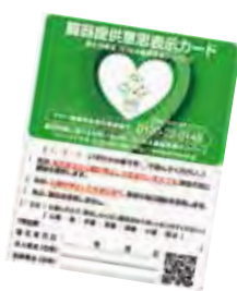
日本臓器移植ネットワークより

日本臓器移植ネットワークは4つの権利を示しています。臓器を「提供する権利」「提供しない権利」、そして臓器を「受け取る権利」「受け取らない権利」です。どの権利も自分で選ぶことができ、尊重されます。臓器を提供しないという意思も大切な権利の一つなので、明確に示しておく必要があります。