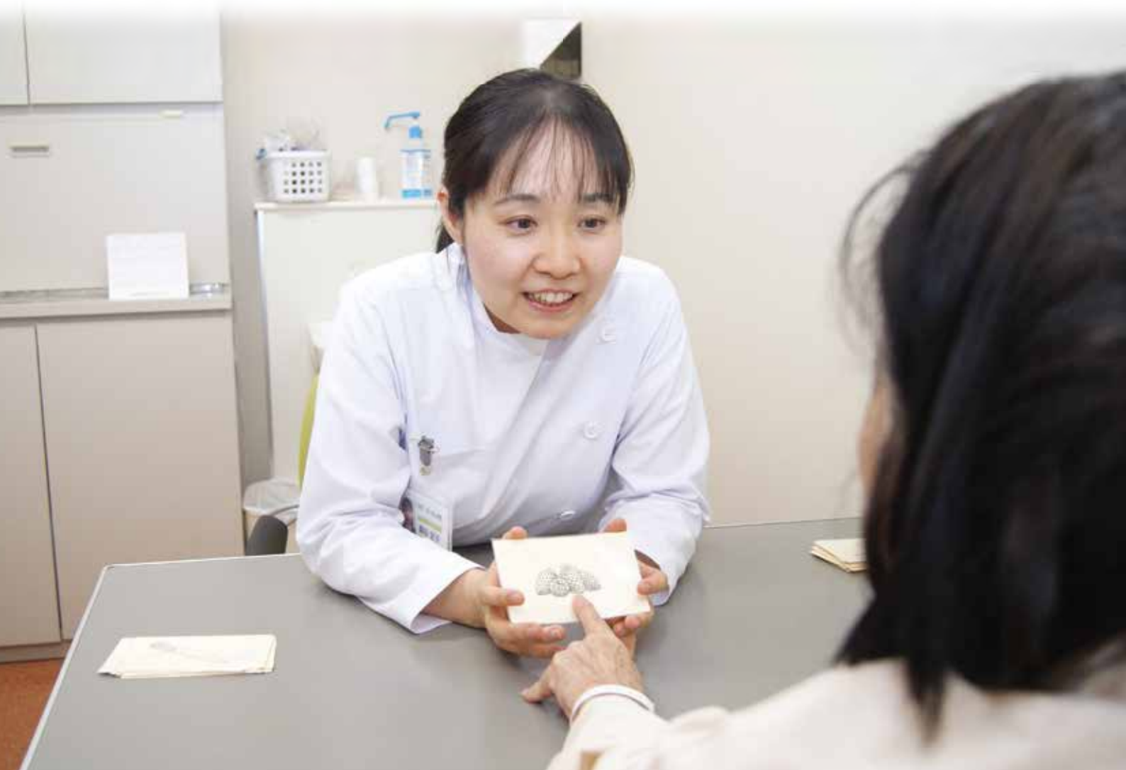
絵カードを使って言葉を思い出す訓練を指導する言語聴覚士