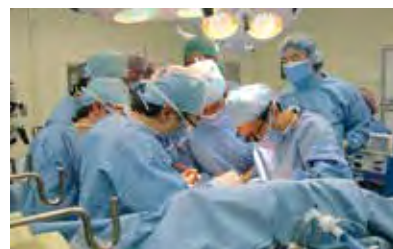
平成23年4月 長崎初の脳死肝移植

脳死臓器移植に直接関わる医療スタッフはもとより、大勢の方々の協力でかけがえのない「いのちの贈りもの」は患者さんに届けられています。