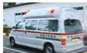
臓器を運搬する救急車

摘出された臓器は、すぐに移植施設に運ばれます。臓器を摘出すれば臓器内の血流が止まるので、時間との戦いになります。ヘリコプターや飛行機を使い、陸路ではパトカー先導で運搬します。