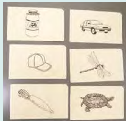
訓練に使うカード