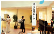
レ・ヴィオレッタによるオータムコンサート