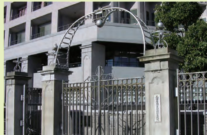
名古屋大学医学部附属病院に移築した愛知病院正門遺構 鶴舞キャンパスには、1914年移転当時の愛知県立医学専門学校・愛知病院の門と囲障がそれぞれ遺構として残されています。