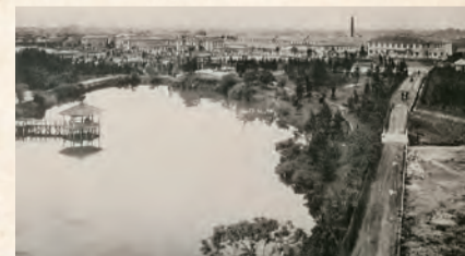
愛知病院正門と鶴舞公園からの景色