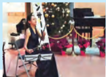
二胡演奏者によるクリスマスコンサート