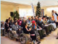
パーキンソン病友の会による合唱や合奏