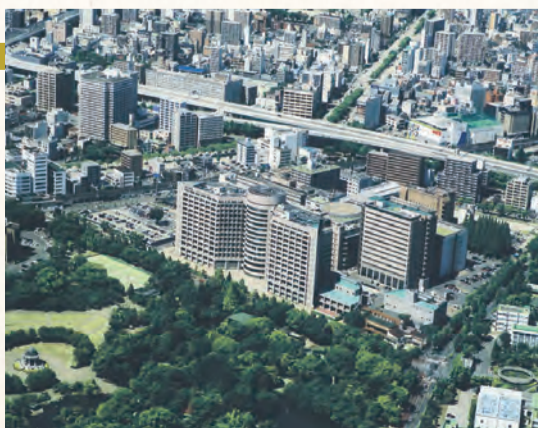
鶴舞キャンパス航空写真