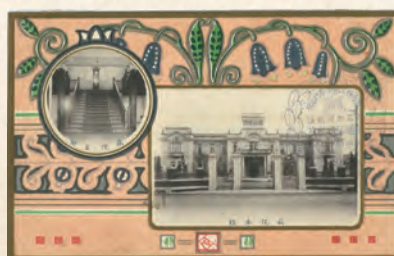
1915年11月3日に愛知県立医学専門学校・愛知病院の新築落成記念として作成された絵葉書