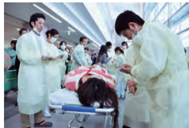
トリアージの様子