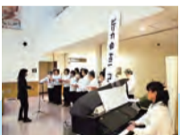
ピリカ会によるミニコンサート

中央診療棟2階リハビリ広場に於て、10月29日(水)にピリカ会によるミニコンサート、11月5日(水)にレ・ヴィオレッタによるオータムコンサート、そして12月19日(金)にパーキンソン病友の会による合唱や合奏や、二胡演奏者によるクリスマスコンサートを開催しました。