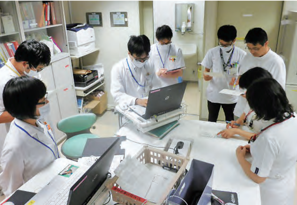
栄養サポートチーム (NST) カンファレンスの様子

名大病院では、2009年11月からNSTが稼働しており、入院患者さんに対して栄養サポートを行う体制を整備しています。NSTのメンバーは医師、歯科医師、管理栄養士、看護師、薬剤師、言語聴覚士、臨床検査技師の職種から構成されており、老年内科教授をリーダーとして、耳鼻いんこう科、糖尿病・内分泌内科、消化器外科一、消化器外科二、消化器内科、腎臓内科、呼吸器内科、中央感染制御部、リハビリテーション部など多くの診療科・部の医師も携わっています。活動内容は、『食事が食べられない』や『体重が減少する』などの栄養不良が認められる場合に、主治医より栄養サポートの依頼が行われると、NSTにて回診とカンファレンスを実施し、依頼元の診療科へ適切な栄養療法について提案を行います。栄養摂取方法の選択では、可能な限り口から食べる楽しみを奪わないよう心がけており、患者さんと付き添いのご家族へ栄養療法の変更点などをお伝