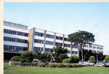
1991年当時の名大病院