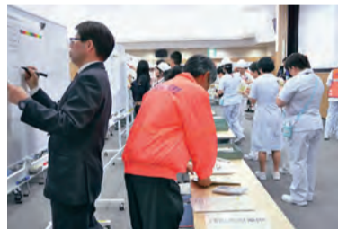
災害対策本部の立ち上げ

災害時においては、病院職員は、どのような条件で招集がかかるのか、次に院内のどこに災害対策本部が立ち上がるのかを知っていなければなりません。新マニュアルでは、名古屋市内震度6弱以上で、中央診療棟3階講堂に災害対策本部が立ち上げられます。本訓練では、本部立ち上げ、院内