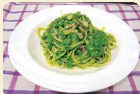
※写真のお皿は17cm、盛り付けは1人分です。

本場のイタリアでは、パンチェッタ（豚ばら肉の塩漬け）を使用しますが、今回は手に入りやすいベーコンで作りました。やわらかく煮こんだブロッコリーが絶妙な一品です。ぜひご家庭でもお試しください。