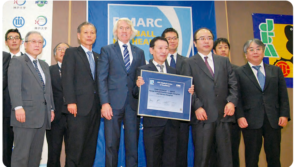
FIFAチーフメディカルオフィサーのシリ・ドヴォラック氏と(右から6番目)