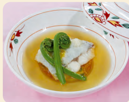
※写真のお皿は17cm×17cm、盛り付けは1人分です。