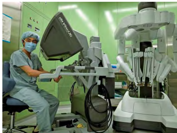
da Vinci Xiと執筆者

近年、低侵襲外科治療として内視鏡外科手術（腹腔鏡・胸腔鏡手術）が普及しつつあります。手術支援ロボットda Vinci Surgical System（DVSS, Intuitive Surgical社）は従来の内視鏡外科手術の問題点を補完し得る複数の特徴を有しており、ロボット支援下胃癌手術によって局所合併症の発生率が減少する可能性が報告されています。本年4月に最新型DVSSであるda Vinci Xi（図1）が薬事承認され、当院でも国内2施設目となるXiによる胃癌手術の導入を行いましたのでご紹介します。