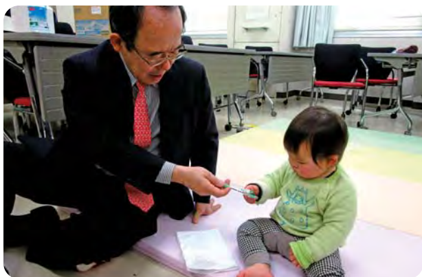
女性医師の子どもとふれあい

ではなぜ、女性医師支援がこれほど重要視されているのか。それは医師不足の折、医学生に占める女性の割合が3割を超えている現状があります。また特に女性医師の多い産婦人科においては日本産科婦人科学会の新規入会者の内、女性が7割を占めています。今後さらに女性医師が増加することが確実であり、多くが今後、結婚・出産により育児期に入ることが想定されます。女性医師が順調に復帰しなければ、今後深刻な医師不足に陥ることが容易に想像されている為、出産後の女性医師がスムーズに医療現場に復帰できるよう対策を講じることが大変重要となってくるのです。特に、静岡県のような医師不足県では深刻な問題となっており、子育て中の女性医師の支援体制整備は喫緊の課題です。当センターは女性医師がスムーズに復帰できるよう様々な支援を取り入れてサポートしています。