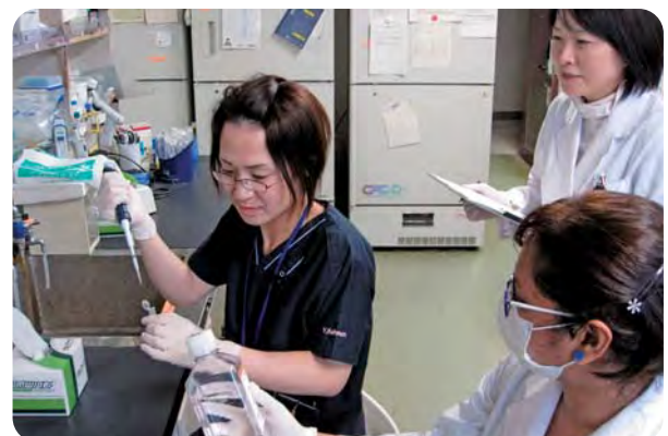
職場支援(実験助手)