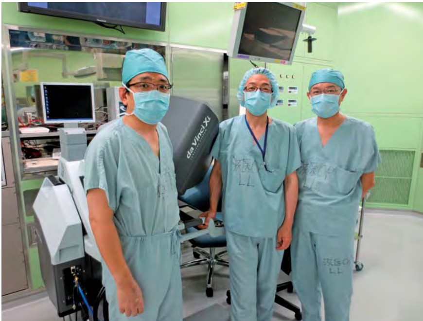
泌尿器科のダヴィンチ執刀チーム(左より古瀬講師、筆者、大塚講師)

ローチでは甚だ不十分であり、先に記したダヴィンチシステムの特徴が大きな力を発揮します。また、Xiを用いると旧来のSおよびSiに比し、骨盤という狭小な操作空間での鉗子の操作性が著しく向上するため、前立腺全摘除術の成績が一層改善されることが期待されています。泌尿器科では、眼前の患者の治療手段としては勿論、将来の術式改良等を目指してロボット支援前立腺全摘除術前後のデータを詳細に蓄積するプロトコルを定めており、より理想的なロボット支援前立腺全摘除術を確立することを目標に、Xiシステムを有効に活用して行きたいと考えております。