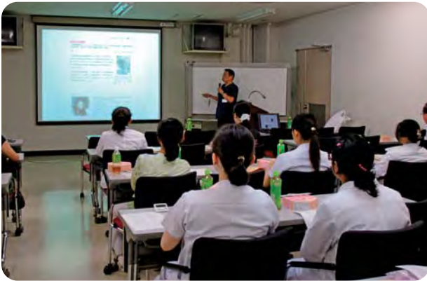
ランチョンセミナー(救急編)

児支援の改善にも力を入れています。昨年は職員のみ利用できる託児所を大学院生に対しても提供できるよう交渉し、利用条件の規約を変更することができました。また、病児病後児保育施設の設置においては大学・病院と交渉を重ね、設置することが承認されました。現在、より良い施設ができるよう開設に向けて準備をしています。