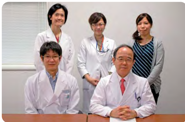
女性医師が働きやすい環境を目指すサポートチーム ～執筆者は前列右・後列右～