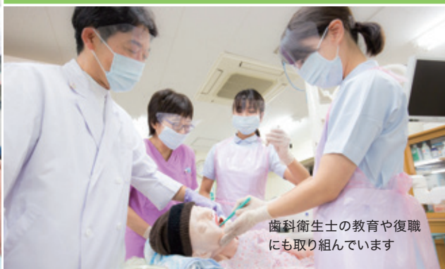
歯科衛生士の教育や復職にも取り組んでいます

本院は大学附属病院であることから、理念として「優れた医療人の育成に努め、患者さん一人ひとりにあった最高水準の歯科医療を提供します。」を掲げています。すなわち、良質で安全な歯科医療を提供するだけでなく、教育病院として将来の歯科医療を担う優れた医療人を育成すること、先端的歯科医療のための臨床研究や各種治験を推進することも本院の重要な使命であることをどうかご理解下さい。