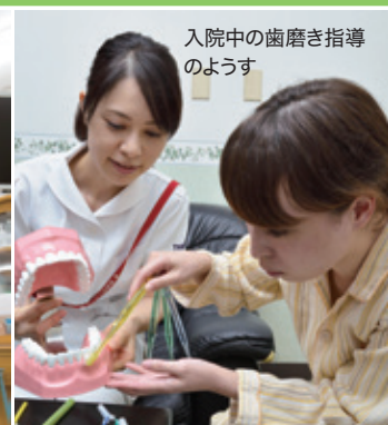
入院中の歯磨き指導のようす