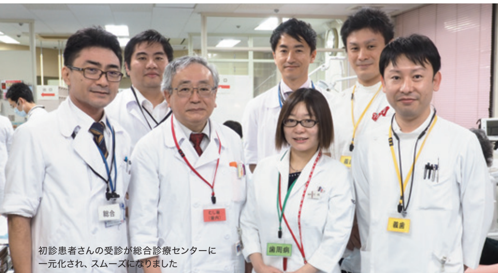
初診患者さんの受診が総合診療センターに一元化され、スムーズになりました