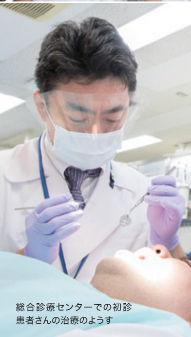
総合診療センターでの初診患者さんの治療のようす