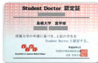
スチューデントドクター認定証

合格した学生には「スチューデントドクター」という資格が与えられ、全国医学部長病院長会議から認定証を授与されます。このスチューデントドクター認定証を授与されることで、学生にはこれから行われる臨床実習に対して自信を持ってもらい、何より責任を自覚してもらいたいというのが、この制度の最大の狙いとなっています。