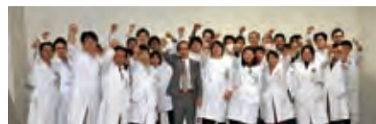
▲“ガンパロー”スタイルの記念写真 ◀新病棟3階にCCUを備える心臓血管センター開設。ハード、ソフト面も新しく改善され医局員も満足気。