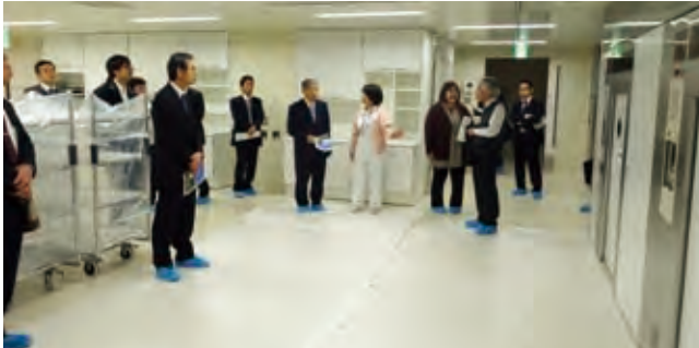
▲2階 材料部 高圧蒸気滅菌装置