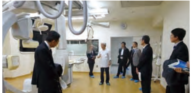
▲1階 放射線部 心血管撮影室