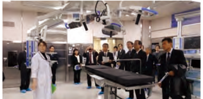
▲3階 手術部 ダ・ヴィンチ対応手術室 (OR1)