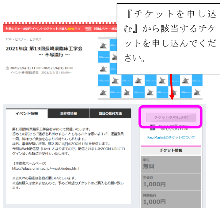
チケット購入画面（デモ画像）