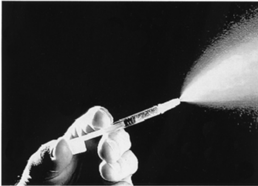
図3 弱毒生インフルエンザワクチン FluMist

す、つまり間接的に高齢者、ハイリスク群を守ろうとしたユニークなインフルエンザ対策であった。