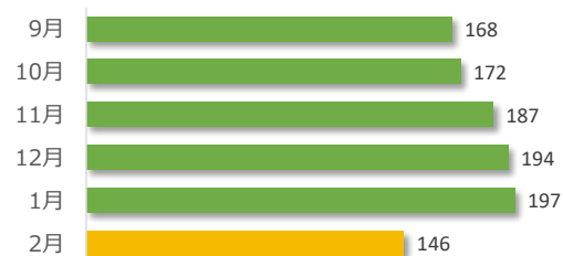
相談件数の推移（直近 6 か月）

2 月の相談件数は 146 件で、相談者の内訳は医療機関が 65 件、遺族等が 73 件、その他・不明が 8 件でした。 遺族等の求めに応じて相談内容をセンターが医療機関へ伝達したものは 0 件（累計 102 件）でした。 医療機関から医療事故の判断について相談を受け、センター合議を開催し、医療機関へ助言したものは 2 件（累計 297 件）でした。