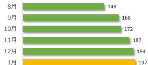
相談件数の推移（直近6か月）

1月の相談件数は197件で、相談者の内訳は医療機関が71件、遺族等が114件、その他・不明が12件でした。 (相談内容については別添参照) 遺族等の求めに応じて相談内容をセンターが医療機関へ伝達したものは3件（累計102件）でした。 医療機関から医療事故の判断について相談を受け、センター合議を開催し、医療機関へ助言したものは11件（累計295件）でした。