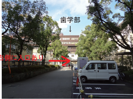
②A 棟から北へ数M歩くと、右側に旧外来棟出入り口入口があるので、そこから外来棟へ。