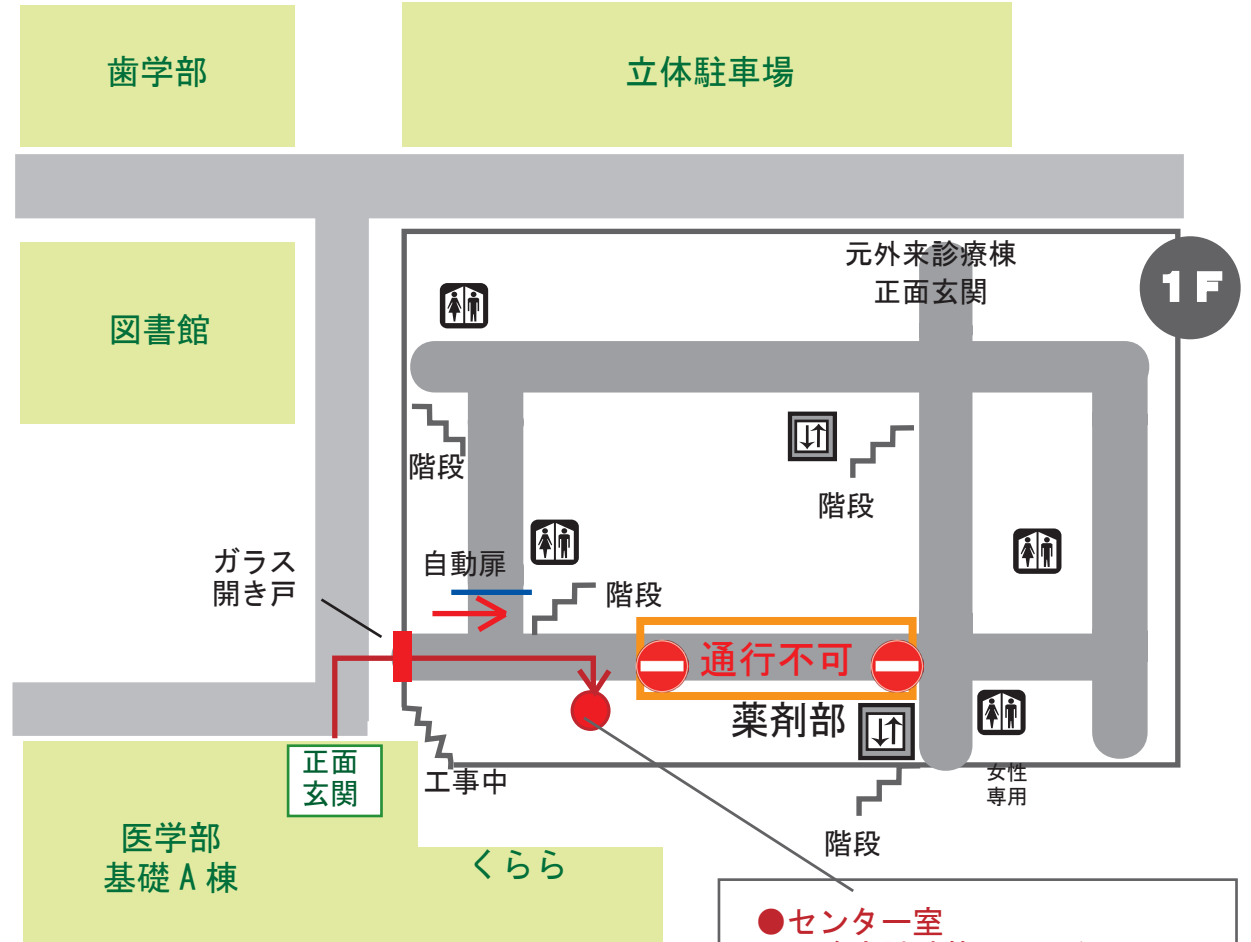
④臨床試験管理センター