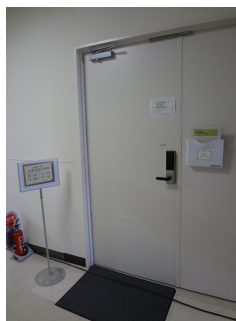
臨床試験管理 センター入口