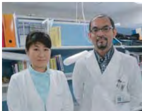
担当 CRC と