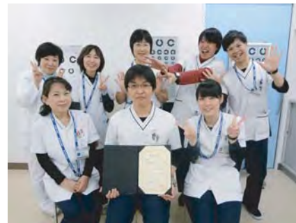
視能訓練士チーム (診療支援部 リハビリテーション部門)