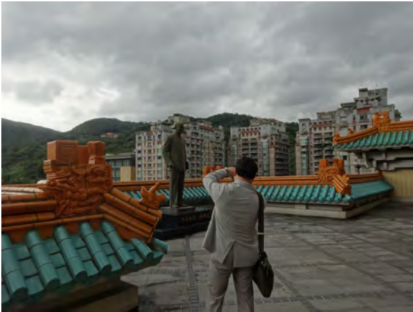
図 17 故宮博物院の「光総統 蔣公造像」（蒋介石の像）の写真を撮る学会参加者

これだけの書を一堂に並べて、見る機会はそう多くはないであろう。国際東洋医学会学会開催と重なるように東洋医学と関連のあるこの特別展が行われたことは幸いであった。